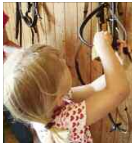
Après la révision de la Loi sur l'encouragement du sport, le sport des enfants J+S pour les cinq à dix ans est désormais ancré dans la loi.