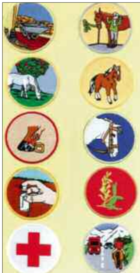
Les badges pour enfants pour le travail à l'écurie, l'affouragement, les plantes vénéneuses, etc. motivent les enfants J+S.

Pour accéder à la formation de moniteur J+S, le candidat doit posséder une licence de la FSSE et avoir obtenu une recommandation suffisante au terme du cours d'entraîneurs de société FSSE. Le cours de moniteurs J+S, d'une durée de 6 jours, a lieu sous une forme fractionnée. Un examen avec une classe d'application a lieu entre chaque bloc de formation sur les installations du club ou de l'école d'équitation. Les personnes avec une formation préalable correspondante ont la possibilité, en suivant le cours d'introduction J+S Sports équestres de quatre jours, d'obtenir la reconnaissance de moniteur J+S. Les personnes qui possèdent la reconnaissance de moniteur J+S peuvent suivre un cours d'introduction J+S pour les enfants et/ou pour le sport des adultes esa. Au niveau supérieur, la formation continue 1, le candidat doit suivre