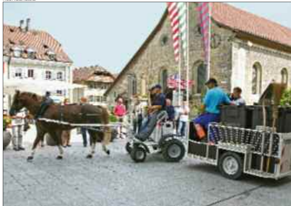
A l'avenir, les attelages puissent fournir des prestations absolument judicieuses pour la communauté au niveau communal.

nel supérieur correspondant au diplôme d'une haute école professionnelle.