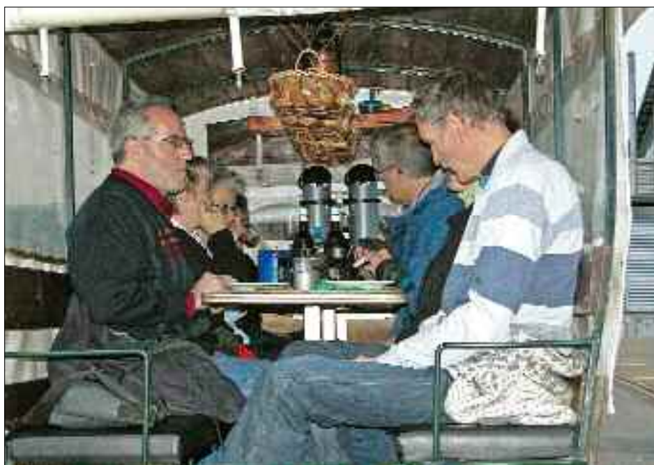
Les invités d'une manifestation avec attelages veulent bénéficier de la meilleure sécurité possible.

communauté au niveau communal. » Dans cette optique, il est important d'offrir la possibilité d'une large formation initiale. Aujourd'hui, il n'existe qu'une seule et unique formation standardisée pour l'attelage, à savoir le brevet de meneur obligatoire pour participer à une épreuve officielle selon les règlements de la Fédération Suisse des Sports Equestres. Si la formation pour l'obtention du brevet dispense les bases nécessaires pour le maniement d'un attelage et qu'elle offre une certaine base pour le quotidien, elle n'a cependant pas beaucoup d'analogie avec une véritable formation professionnelle complète. D'autre part, s'il existe absolument en Suisse de bonnes exploitations formatrices travaillant à un niveau élevé, le profane n'a aucune possibilité de savoir quelles sont les qualifications d'un formateur.