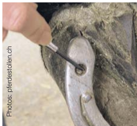
Avant de pouvoir visser les crampons, les trous prévus à cet effet doivent être nettoyés.

Les crampons modernes taraudent également les portes à vis lorsqu'on les visse. Ils sont en principe fabriqués dans un acier trempé spécial, avec quelque fois une pointe Widia en guise de noyau et une surface galvanisée. Normalement, deux crampons sont placés sur chaque fer, un à