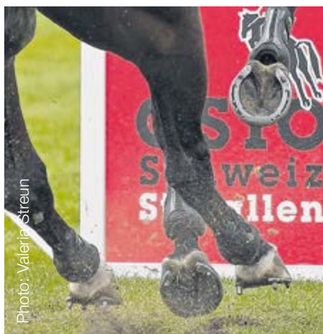
Les crampons offrent de l'appui aux chevaux de saut sur des terrains en herbe glissants ou boueux.

Lorsque l'état du sol est difficile, par exemple lors d'une sortie dans la neige et la glace ou sur un parcours de saut dont le sol est glissant, on fixe un antidérapant supplémentaire sous forme de crampons. On sait en effet que si les chevaux ne trouvent pas de base solide avec leurs sabots, ils sont rapidement déstabilisés. Et s'ils dérangent, cela peut entraîner des distensions voire même de déchirures de tendons et de ligaments et les quadrupèdes risquent de graves blessures. «Les sabots des chevaux ont besoin d'appui!», informe le vétérinaire équin et expert du sport de saut, le Dr méd. vét. Stéphane Montavon. «Pourtant, avant de se pencher sur le choix des bons crampons, il faudrait tout d'abord se demander si les conditions du sol permettent vraiment une sortie ou un départ en compétition.» Si les crampons offrent au cheval une meilleure