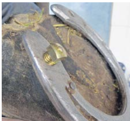
Il faut faire attention à ce que les crampons soient vissés droits et non de biais dans le pas de vis.