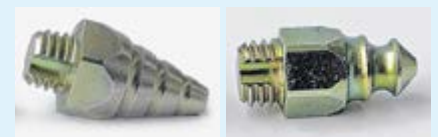
Longs crampons cônes rainurés